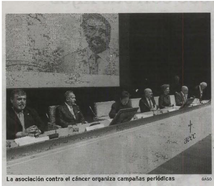
La asociación contra el cáncer organiza campañas periódicas