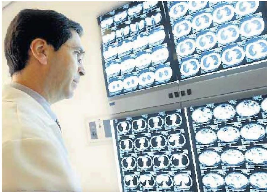
El Hospital Costa del Sol será de los primeros en incorporarse al programa. :: SUR

El procedimiento de inclusión de un paciente en el plan de diagnóstico precoz se iniciará con el envío de una carta informativa a